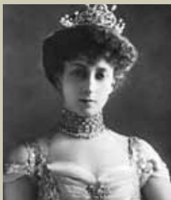
Kva for nasjonalitet hadde dronning Maud opphavleg?