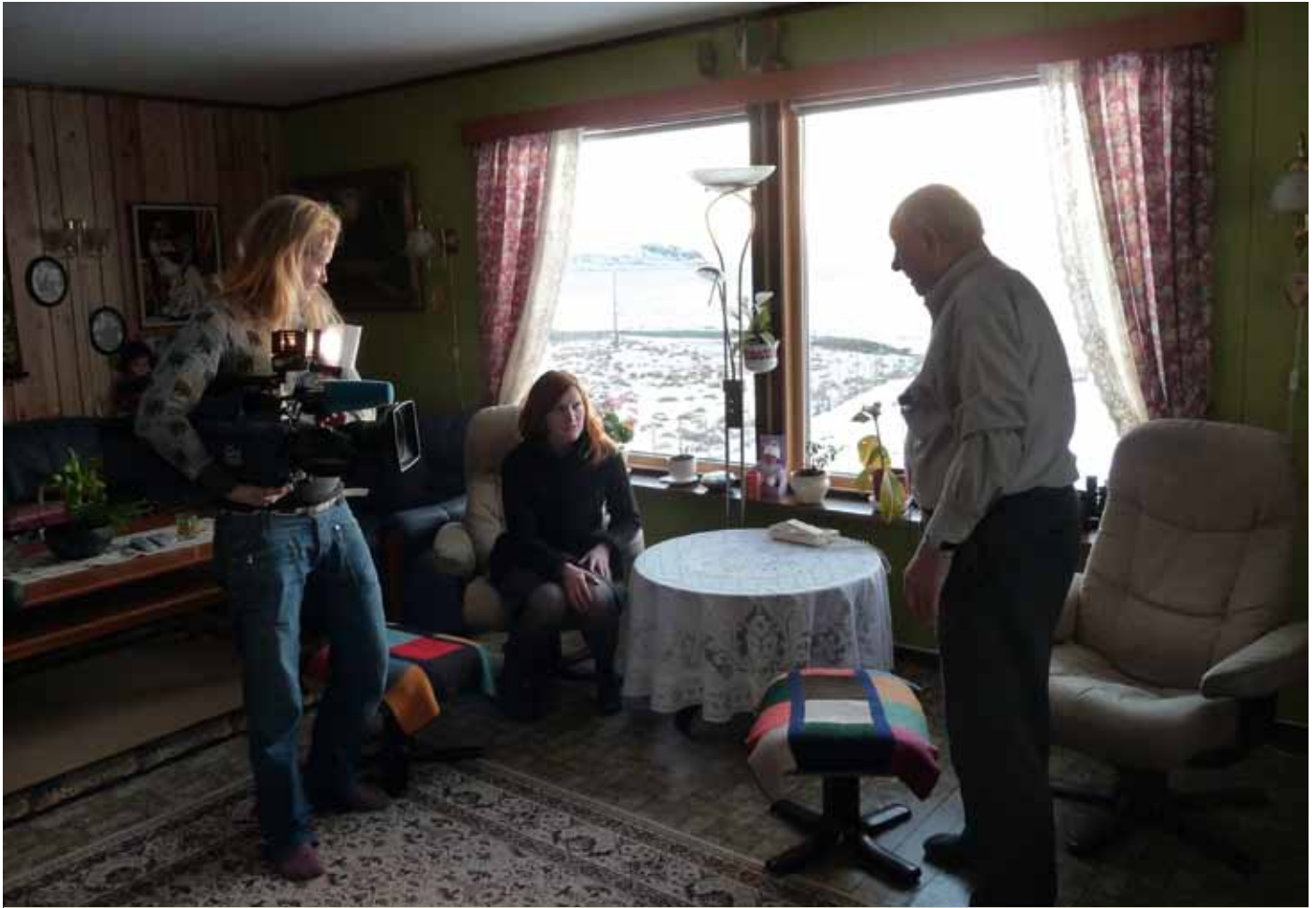
NRK er med på slep når forskarane skal intervju ein informant på Vannøya i Troms.