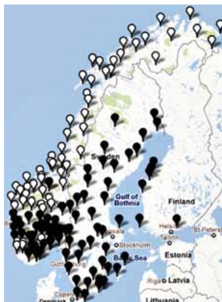
Kartet viser utbreiinga av setninga «Kva du heiter?». Kvitt er høg skår, grått middels og svart er låg skår.

dei svenske informantane. For på svensk kjem infinitivsmerket etter nektinga: «Kjell hadde lenge prøvd å ikkje kome for seint på jobb.» Men