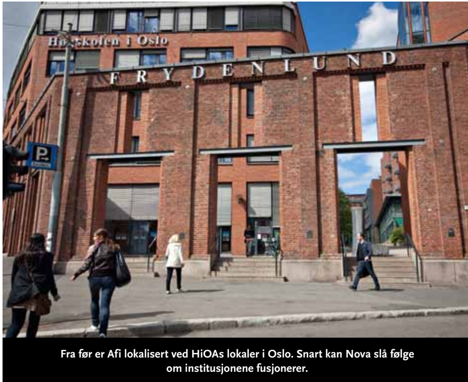
Fra før er Afi lokalisert ved HiOAs lokaler i Oslo. Snart kan Nova slå følge om institusjonene fusjonerer.

Å få en styrket organisasjon er også målet for Høgskolen i Oslo og Akershus, som har invitert i alt seks frittstående samfunnsvitenskapelige forskningsinstitutt til å fusjonere. Nova og Afi