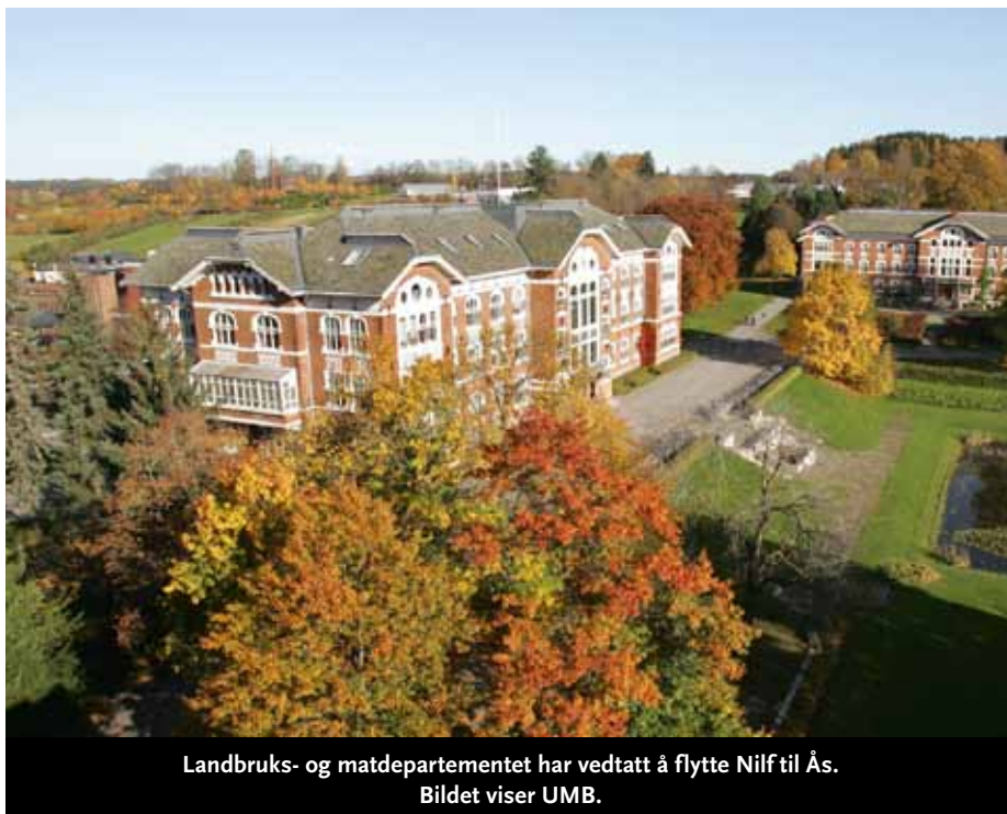
Landbruks- og matdepartementet har vedtatt å flytte Nilf til Ås. Bildet viser UMB.

Høsten 2010 ledet Lars Sponheim en utred-